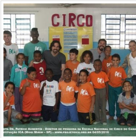
( https://oregional.net/wp-content/uploads/2016/05/IMG_1358.jpg )