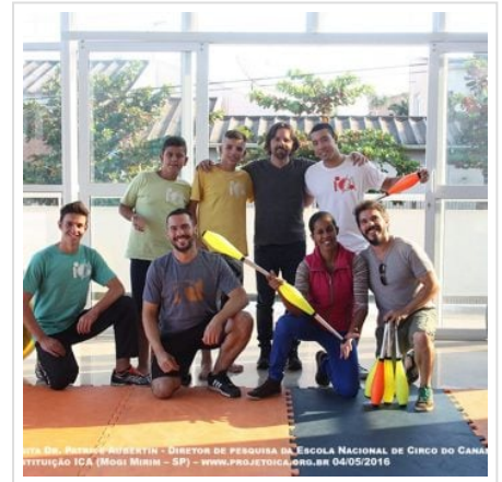
( https://oregional.net/wp-content/uploads/2016/05/IMG_1417.jpg )