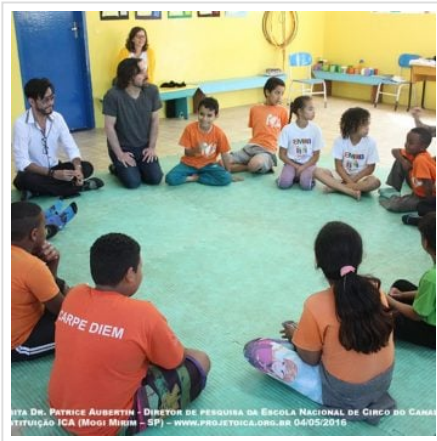
( https://oregional.net/wp-content/uploads/2016/05/IMG_1319.jpg )